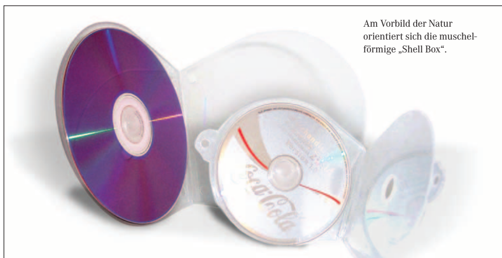
Am Vorbild der Natur orientiert sich die muschelförmige „Shell Box“.

Ebenfalls neu ist die „Shell Box“ aus Polypropylen, bei der sich der Betrachter an ein Beispiel aus der Natur erinnert fühlt. So ist die transparent-matte Verpackung exakt wie eine Muschelschale angelegt, allerdings mit dem Unterschied, dass die geschlossene Verpackung Abheftlöcher für einen Ringordner aufweist, der eine bessere Archivierung der Discs ermöglichen soll. Eine besondere Neuheit stellt eine Weißblechbox für DVDs dar. Die rechteckige Metalldose von KMS ist mit einem Schar-